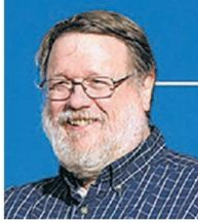
▲ ரேமண்ட் டாம்லின்சன்